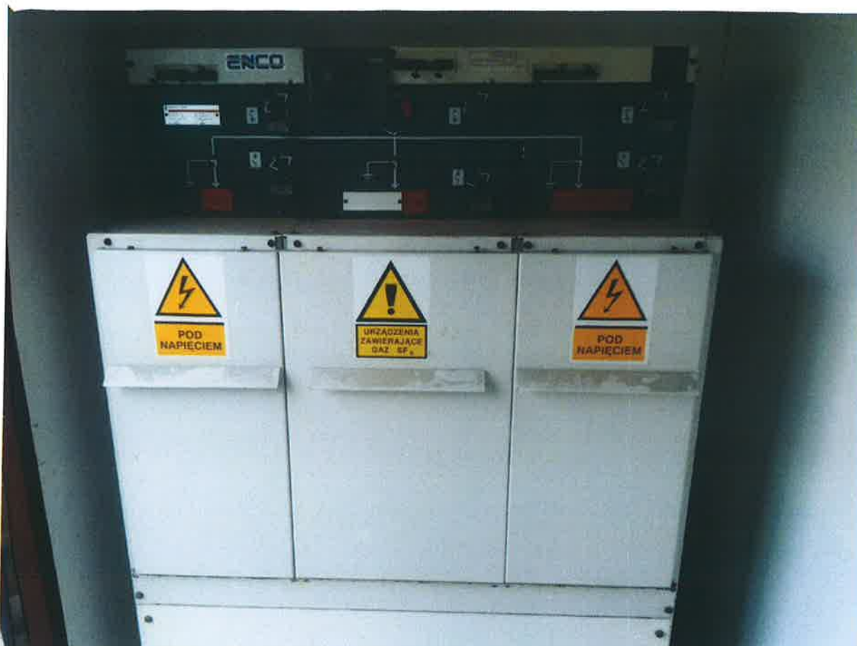
1.2. Trójfazowy Wskaźnik Przepływu Prądów Zakłócenionych (FPI) faza-ziemia i faza-faza, do sygnalizacji lokalnej MERLIN GERIN Flair 279